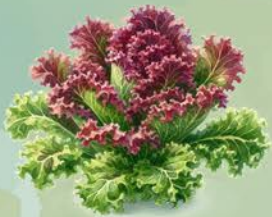
Lollo Rosso Salat