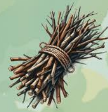
Ungespritzte Obstbaum- äste