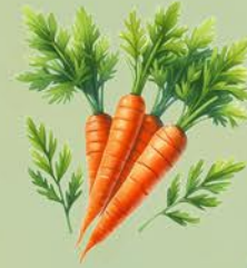
Möhren mit Möhrengrün